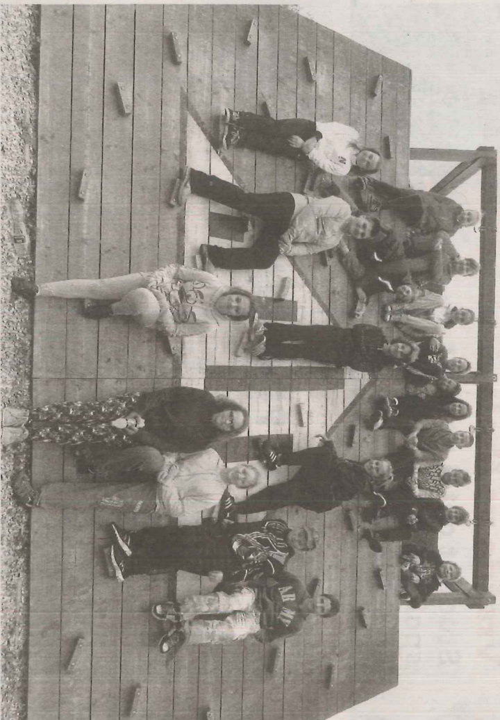
V OLMOUCI. Jednadvacet žáků Základní školy v Bělé pod Bezdězem se jelo do Olomouce učit zeměpis do terénu. Odnесли si spoustu zážitků a nových zkušeností.