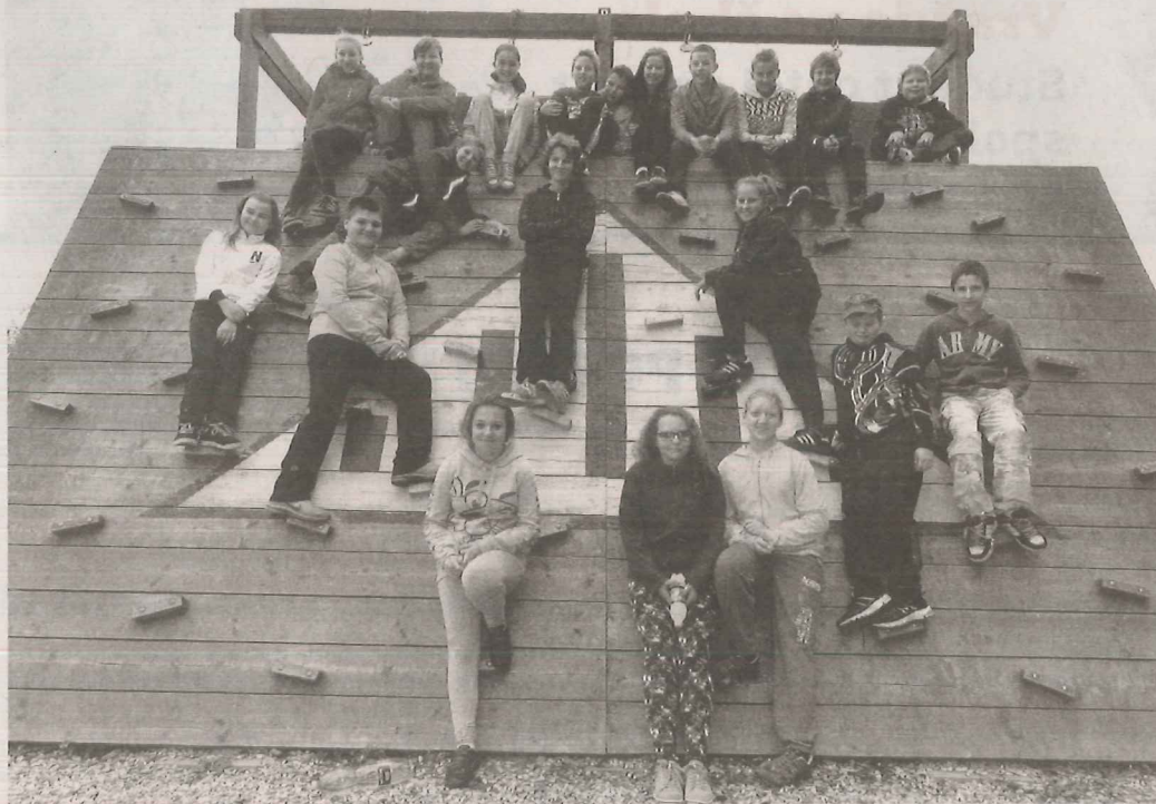
V OLOMOUČI. Jednadvacet žáků Základní školy v Bělé pod Bezdězem se jelo do Olomouce učit zeměpis do terénu. Odnesli si spoustu zážitků a nových zkušeností.

V Olomouci si nejdříve zajeli na Svátý Kopeček, kde si prohlédli baziliku Navštívení Panny Marie a poté pokračovali do nedaleké zoologické zahrady. Na tomto místě už na